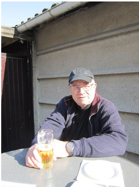
Één van onze super gemotiveerde kassiers!